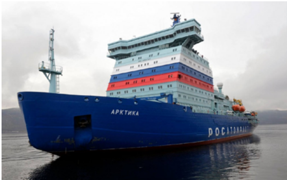
Figura N°01: Rompehielos nuclear Arktika